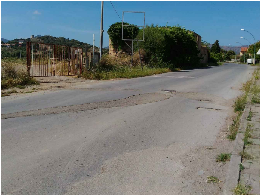
1 - Viale Rinascita