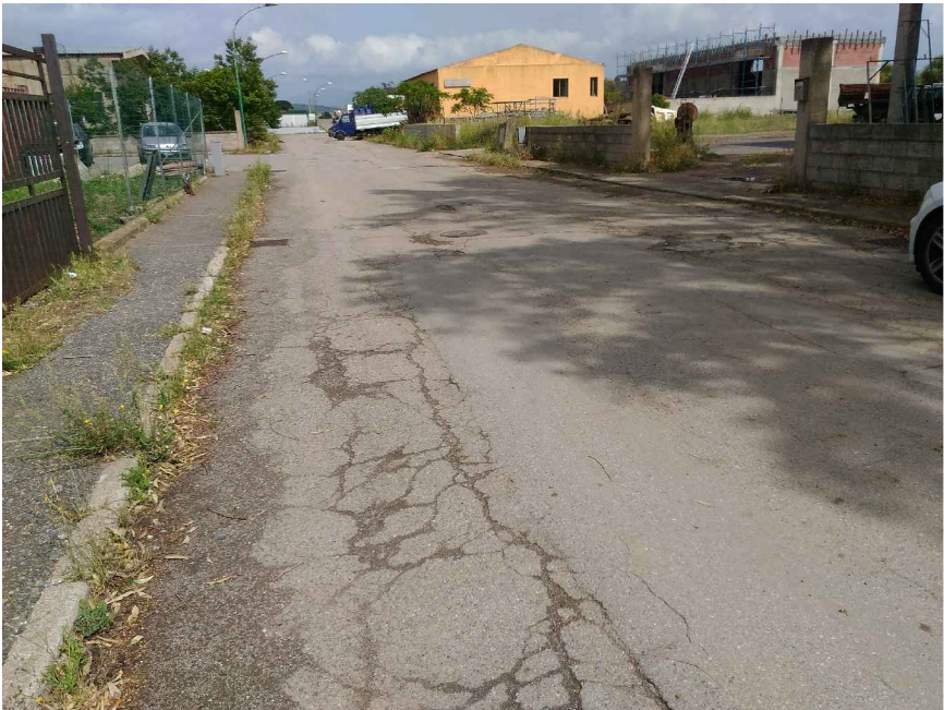
3 - Via Canale