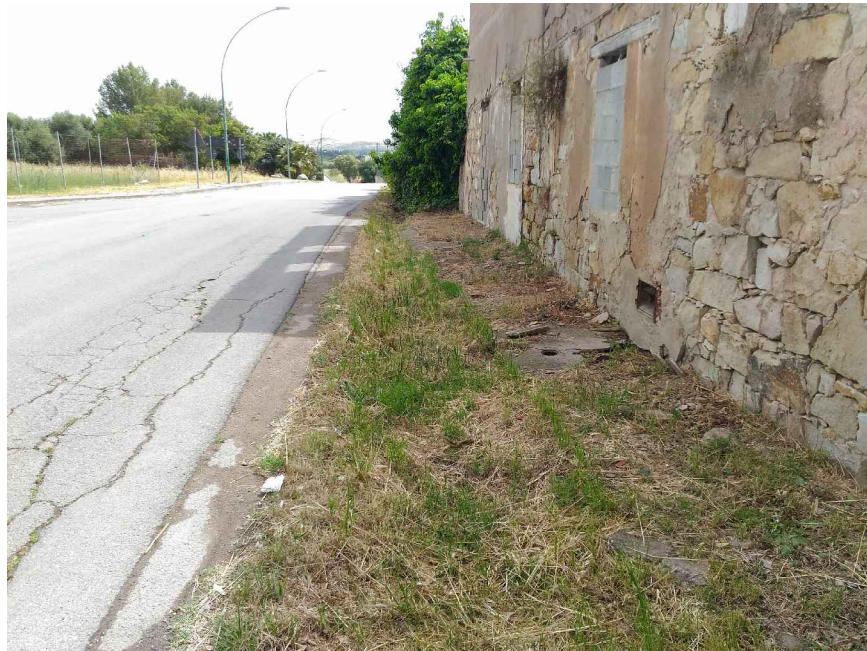
2 - Particolare marciapiede Viale Rinascita