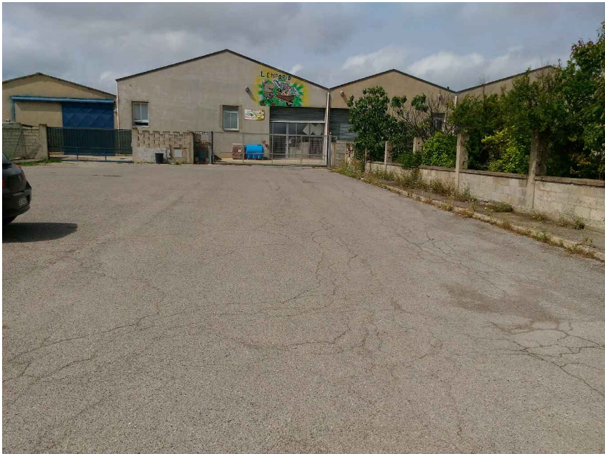
4 - Sllargo Via Canale