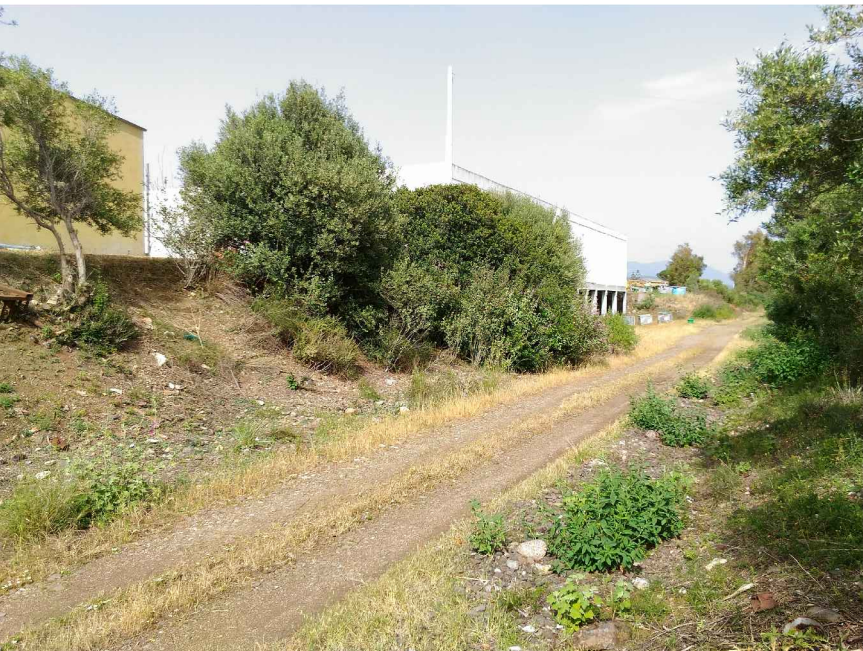
8 - Ex Ferrovia