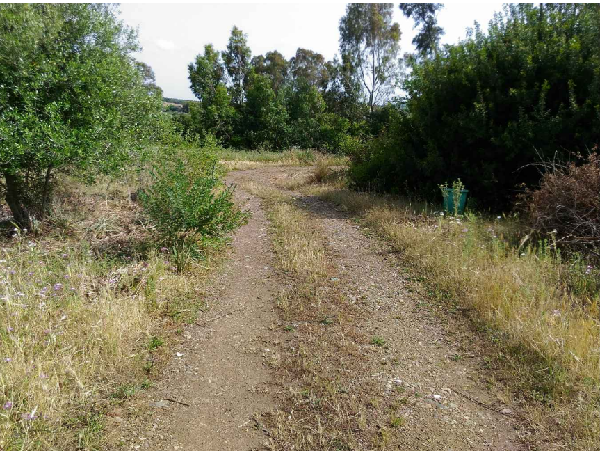
7 - Ex Ferrovia