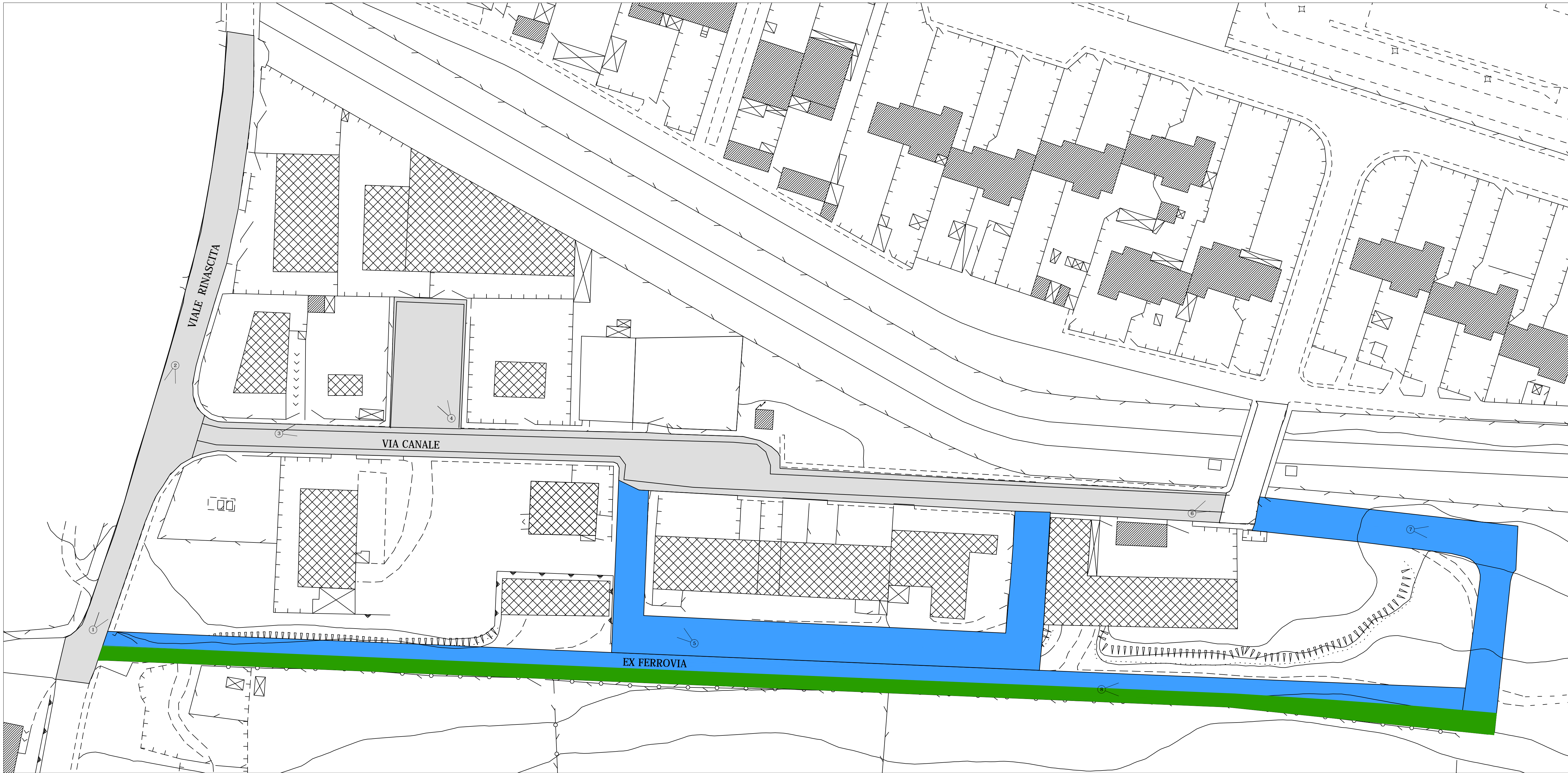
PLANIMETRIA GENERALE Scala 1:500