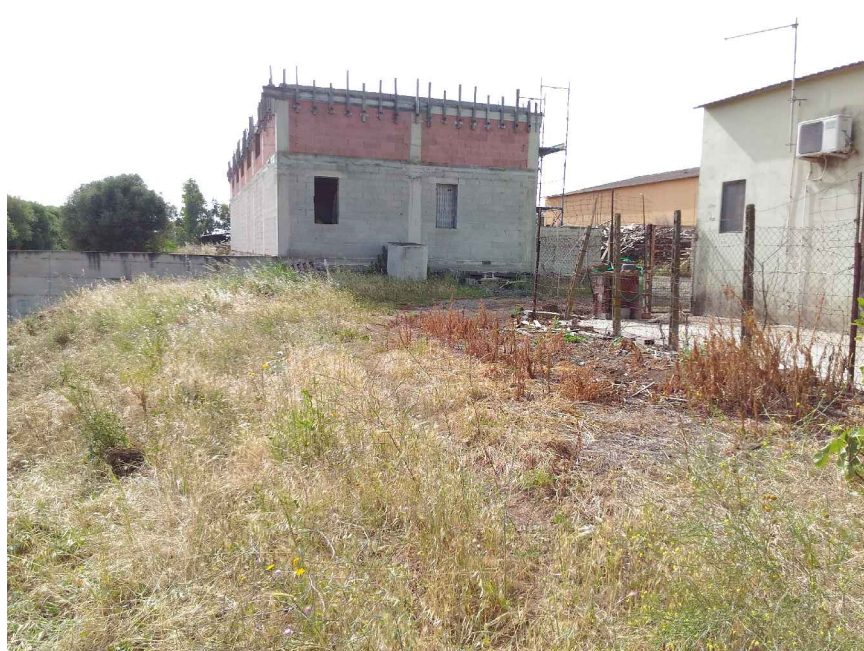
5 - Traversa Via Canale